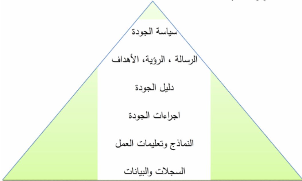
الشكل (3) مستويات توثيق نظام إدارة الجودة في المؤسسات التعليمية

هذه الأسس الثلاث هي التي تضمن صحة إجراء تحديد الرسالة والأهداف والرؤية للمؤسسة التعليمية، فبدونها لا يمكن لهذا الإجراء أن يحقق الغاية منه.