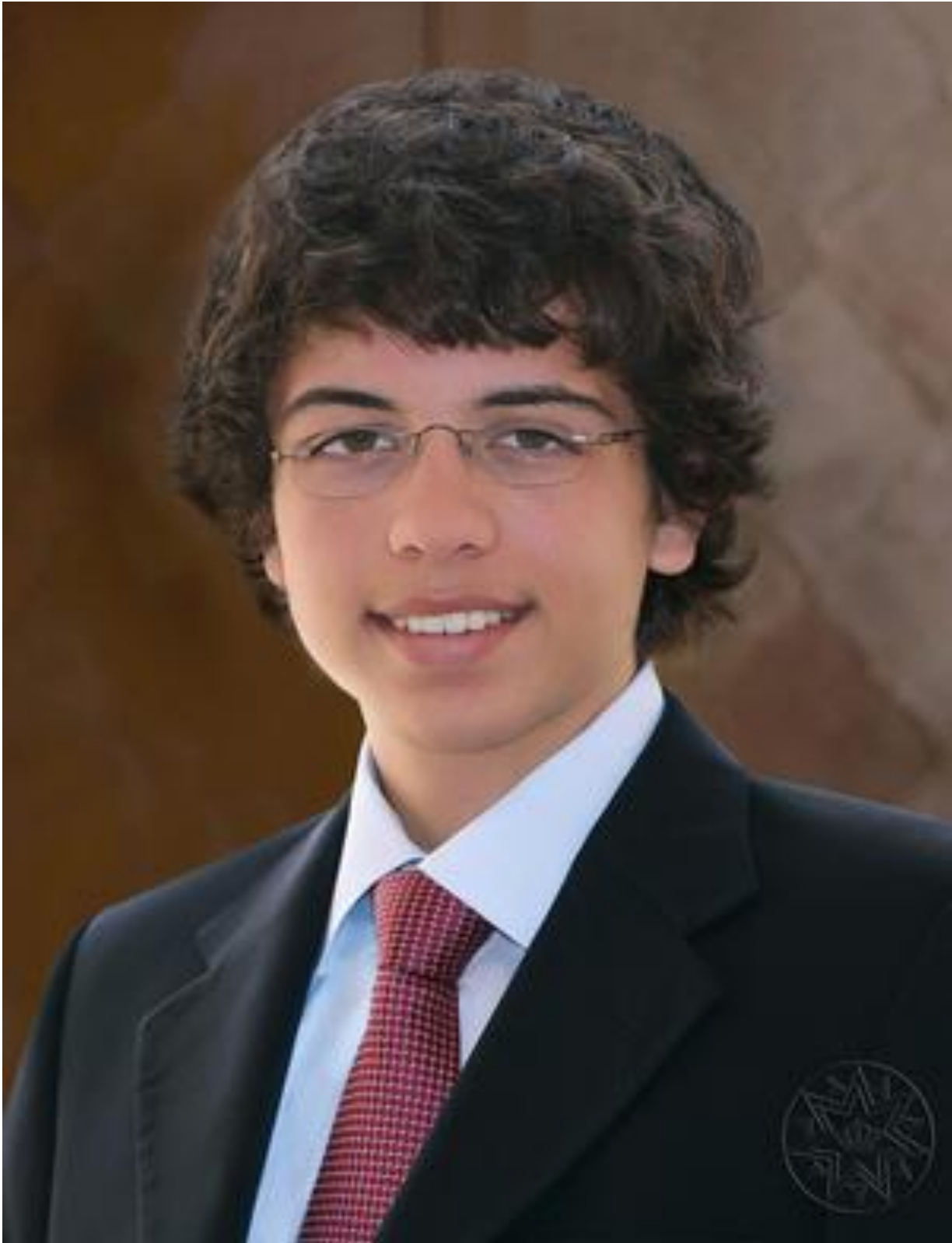
حضرة صاحب السمو الملكي الأمير حسين بن عبدالله الثاني ولي العهد المعظم