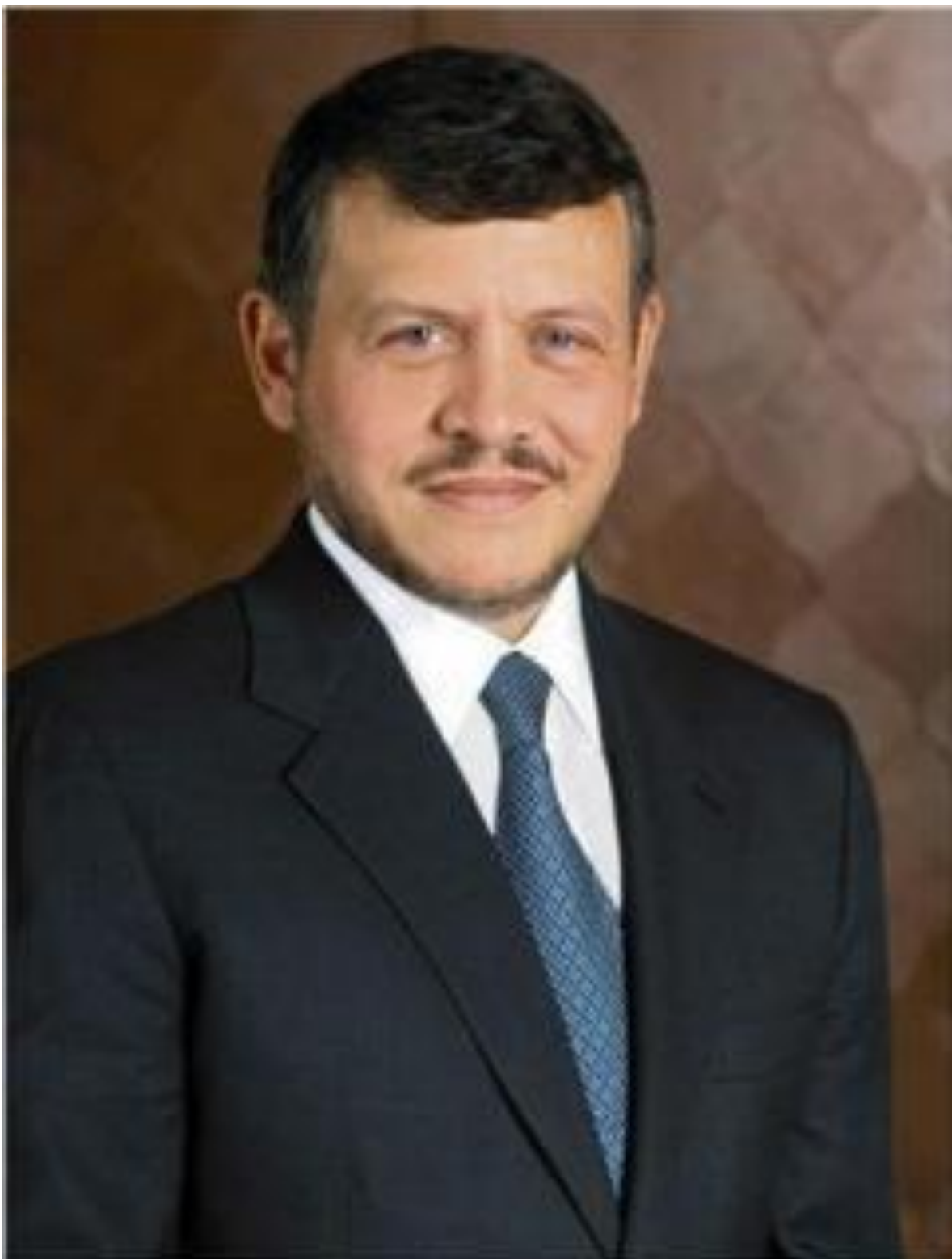
حضرة صاحب الجلالة الملك عبدالله الثاني ابن الحسين المعظم