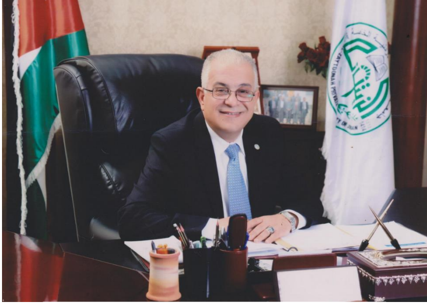
كلمة رئيس الجامعة / الأستاذ الدكتور تركي ابراهيم عبيدات